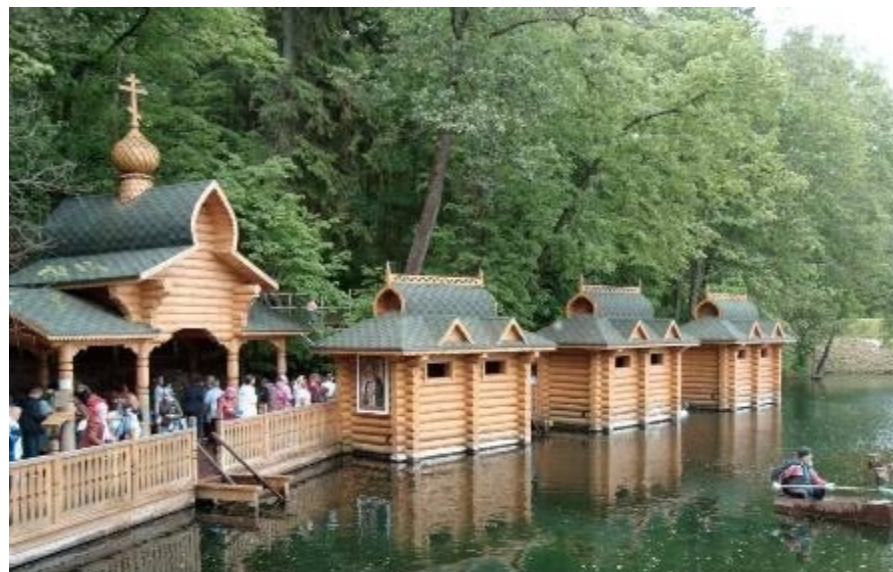
Источник Преподобного Серафима Саровского

Наиболее любимое святое место среди православных христиан — это ДИВЕЕВО. Там расположен Свято-Троицкий Серафимо-Дивеевский монастырь. В этой святой обители подвизались Дивеевские святые жены, там находятся мощи преподобного Серафима Саровского, а так же Канавка Божией Матери, по которой ежедневно сестры обители и паломники совершают Крестный Ход. В самом Дивеево и его окрестностях есть множество Святых Источников, где происходят чудеса. Недалеко от Дивеево, в Успенском храме п.Суворова, покоятся мощи 4-х мучениц за Христа, пострадавших от рук безбожников в начале 20 века. В г.Арзамас, в Никольском монастыре, находится икона Богородицы "Избавление от бед страждущих", которая уже несколько лет обновляется. Паломнические поездки в Дивеево из Красноярска состоятся на Светлый Праздник Воскресения Господня (с 9 по 20 апреля), с 1 по 12 июня, на Праздник Преподобного Серафима Саровского (с 23 июля по 5 августа), на Успение (с 20 по 31 августа, однако часть группы может остаться в Дивеево еще на 2 дня и вернуться в Красноярск 2 сентября), а так же на Покров (10-21 октября)